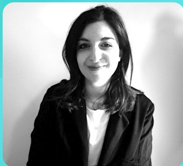
Federica Sciacca Press Office